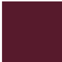
NCS S 6030-R10B NY FARVE